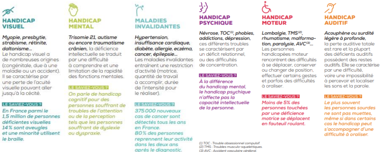
Figure 1 : les différentes catégories de situation de handicap

Les situations de handicap se classent en plusieurs catégories :